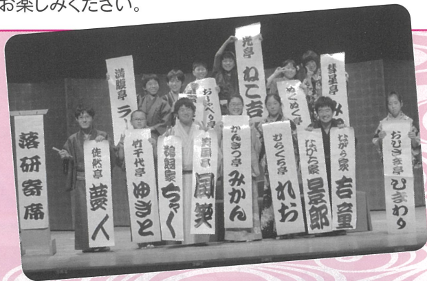
※画像はすべて、以前の落研寄席の様子です。

2009年に第1回落研寄席が開催されて以来、今回で14回目の開催となりました。この間、大学の落研の多くの学生や、小学生の皆さんが出演してくださいました。その中には、プロの噺家として活躍している方もみえます。がんばって練習し続けた岡崎市立男川小学校落語部の皆さんや落語研究会で常に話芸を磨いている大学生の皆さんによるフレッシュで若さあふれる落語をお楽しみください。