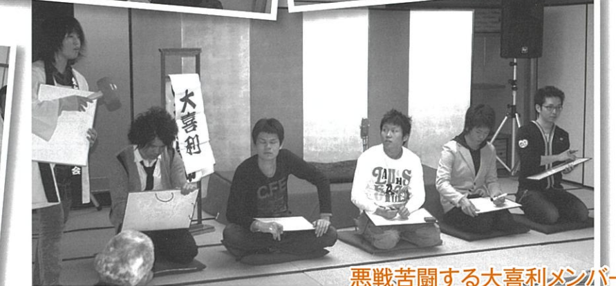
悪戦苦闘する大喜利メンバー