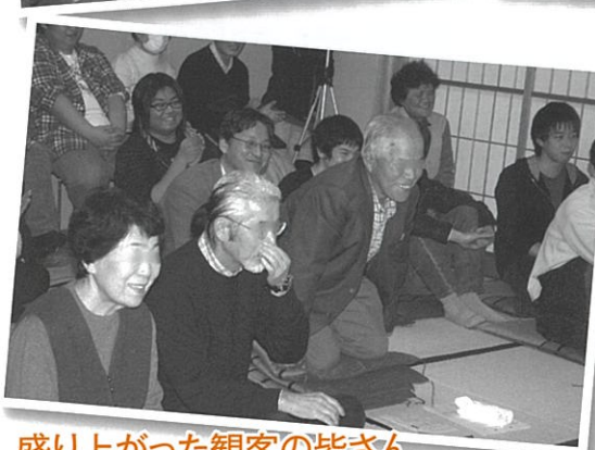
盛り上がった観客の皆さん