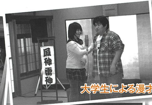
大学生による漫才