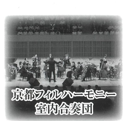
京都フィルハーモニー室内合奏団