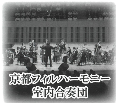
京都フィルハーモニー 室内合奏団