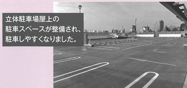
立体駐車場屋上の駐車スペースが整備され、駐車しやすくなりました。