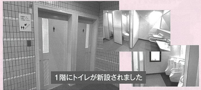
1階にトイレが新設されました