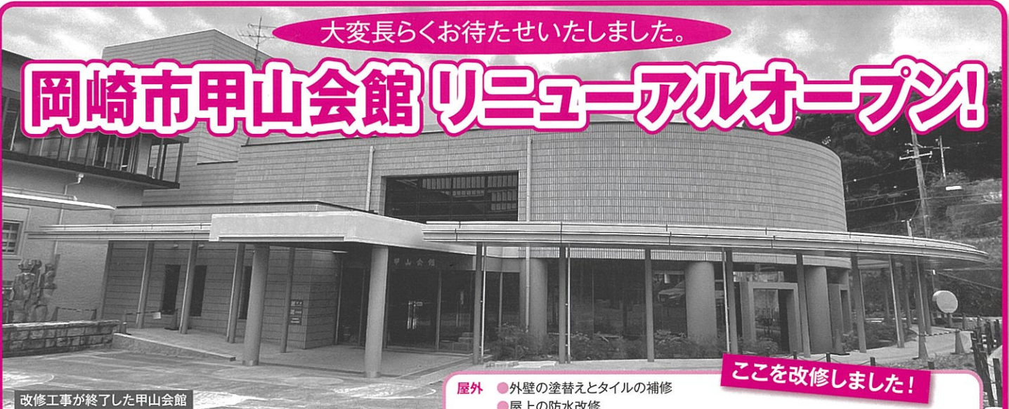
改修工事が終了した甲山会館

昨年の9月から改修工事を行ってきました甲山会館が、より安全により使い勝手のよい施設として改修オープンしました。これからもよろしくお願いいたします!