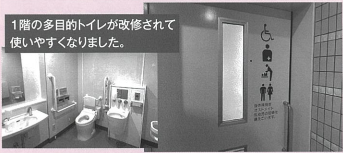
1階の多目的トイレが改修されて使いやすくなりました。