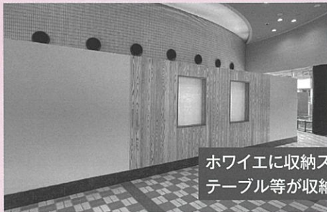
ホワイエに収納スペースが新設され、テーブル等が収納されています。