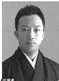
出演者 市川猿之助 他

どちらの催事も、本紙の発行時点で、すでに完売となっていた場合は、ご容赦願います。